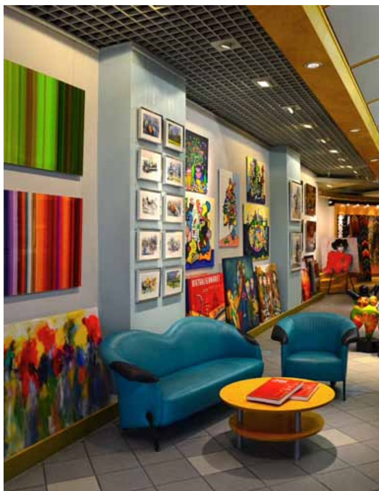
Sitzgruppe für ein Beratungsgespräch oder zum Schmöckern im Katalog

Die Postergalerie München hat seit vielen Jahren ihren Platz im Asamhof an der Sendlinger Strasse. Das ist die Münchner Altstadt. Die Chefin gehören zu den Mie-